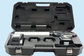
Im praktischen Koffer